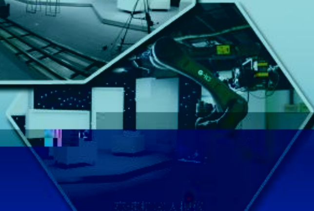
工业机器人操作室